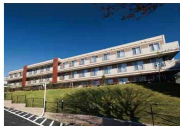
たっぷりの開放感を感じられる高台のホーム