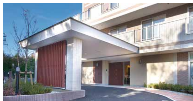
ここに住まう方々やご家族を優雅に出迎えるエントランス(平成23年12月撮影/建物・賃借)

「千葉」駅からも徒歩圏の閑静な住宅街、開放的な雰囲気を醸し出す「SOMPOケア ラヴィーレ千葉椿森」。高台から見渡す自然は緑溢れる景勝で、心地よい寛ぎの日々をお過ごしいただけます。大空を仰ぐ開放感に満ちあふれた快適で安心な生活が始まります。