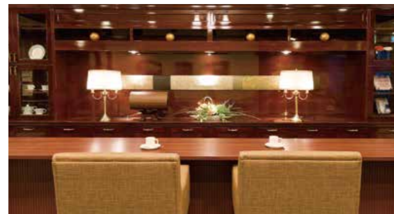
思い思いにお過ごしいただけるカフェ

窓の大きなダイニング(食堂)や各階に設けたラウンジをはじめ、日常的にゆとりと癒しを実感できる共用空間・設備をご用意しています。