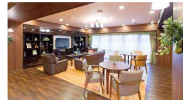
ご入居者さまの憩いの場となるラウンジ