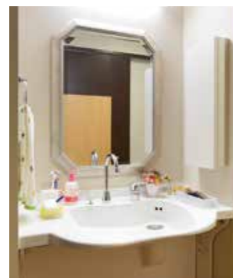
清潔感のある洗面化粧台を各室に設置