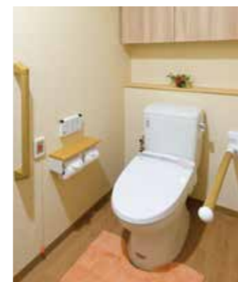
車椅子でも使いやすいトイレ

昨日より今日、今日より明日と、笑顔の数がひとつでも増えていくように。 お一人おひとりにとって本当にうれしい介護をカタチにしていまいます。