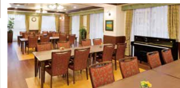
大きな窓に面し明るさいっぱいのダイニング(食堂)

来訪のしやすさなど様々な便利が実感できる駅近ホーム。 自然の豊かさを感じられる、充実の日々をお楽しみください。