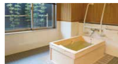
ゆったりとした気分で入れるヒノキ風呂