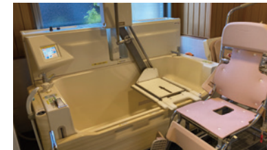
機械浴によって安全な入浴環境を提供