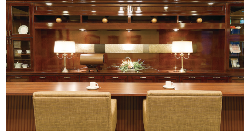
思い思いにお過ごしいただけるカフェ

窓の大きなダイニング(食堂)や各階に設けたラウンジをはじめ、日常的にゆとりと癒しを実感できる共用空間・設備をご用意しています。