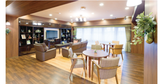
ご入居者さまの憩いの場となるラウンジ