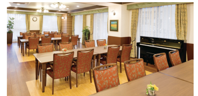
大きな窓に面し明るさいっぱいのダイニング(食堂)

来訪のしやすさなど様々な便利が実感できる駅近ホーム。 自然の豊かさを感じられる、充実の日々をお愉しみください。