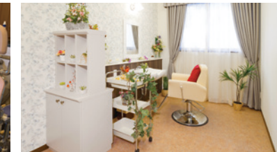
いつまでも美しくいていただくための理美容室