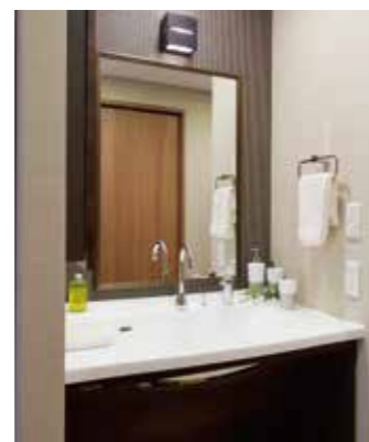
清潔感のある洗面化粧台を各室に設置