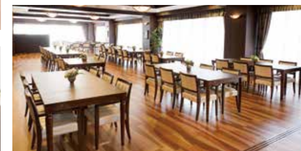
大きな窓に面し明るさいっぱいのダイニング(食堂)

昨日より今日、今日より明日と、笑顔の数がひとつでも増えていくように。お一人おひとりにとって本当にうれしい介護をカタチにしていまいます。