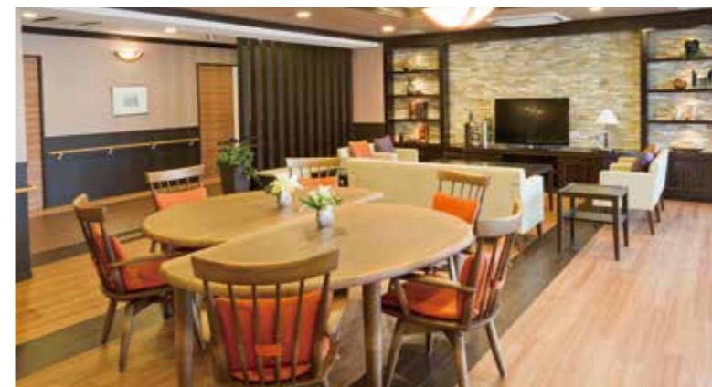
ご入居者さまの憩いの場となるラウンジ

窓の大きなダイニング(食堂)や各階に設けたラウンジをはじめ、日常的にゆとりと癒しを実感できる共用空間・設備をご用意しています。