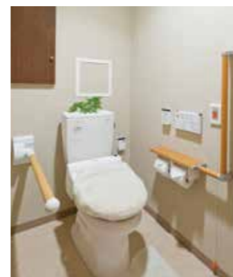
車椅子でも使いやすいトイレ