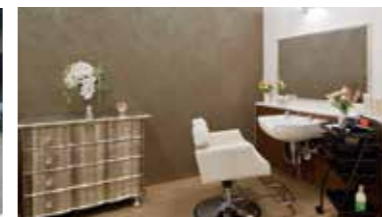
いつまでも美しくいていただくための理美容室