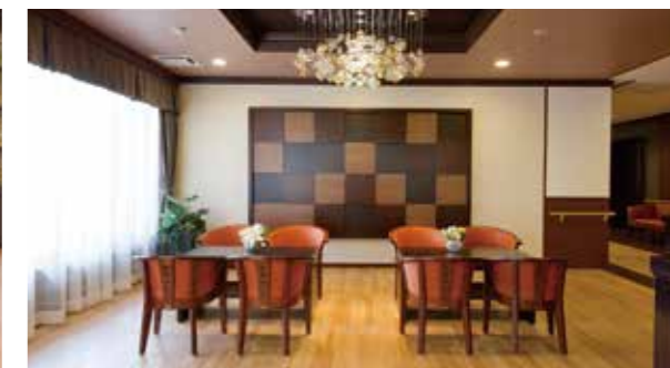
思い思いにお過ごしいただけるカフェ