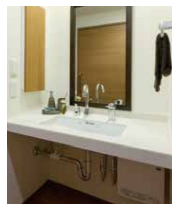
清潔感のある洗面化粧台を各室に設置