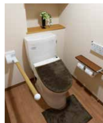
車椅子でも使いやすいトイレ

昨日より今日、今日より明日と、笑顔の数がひとつでも増えていくように。 お一人おひとりにとって本当にうれしい介護をカタチにしていまいます。