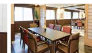
訪問されたご家族と和やかなひとときを過ごせるファミリーダイニング