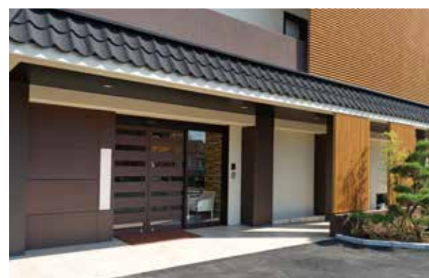
ここに住まう方々やご家族を優雅に出迎えるエントランス ※建物写真は平成23年11月撮影/建物:賃借

木々の緑、すぐそばを流れる鳩川など 近隣の自然との調和を目指し、 和の装いをホームの様々な場所に取り入れました。 前払金が一律380万円のご入居いただきやすい価格設定も魅力です。