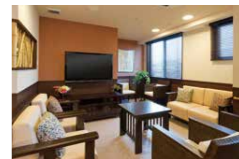
思い思いにお過ごしいただけるラウンジ