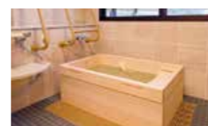
ゆったりとした気分で入れるヒノキ風呂