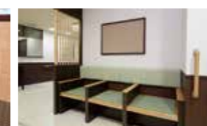
お風呂上がりくつろげる湯上がりコーナー