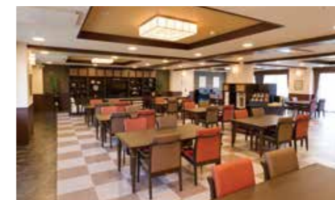
大きな窓に面し明るさいっぱいダイニング(食堂)