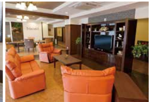
ご入居者さまの憩いの場であるラウンジ