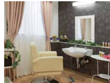
いつまでも美しくいていただくための理美容室

ご入居者さまの団らんの場となるラウンジ、木の香りに包まれるヒノキ風呂など、日常的にゆとりと癒しを実感できる共用空間・設備をご用意しています。