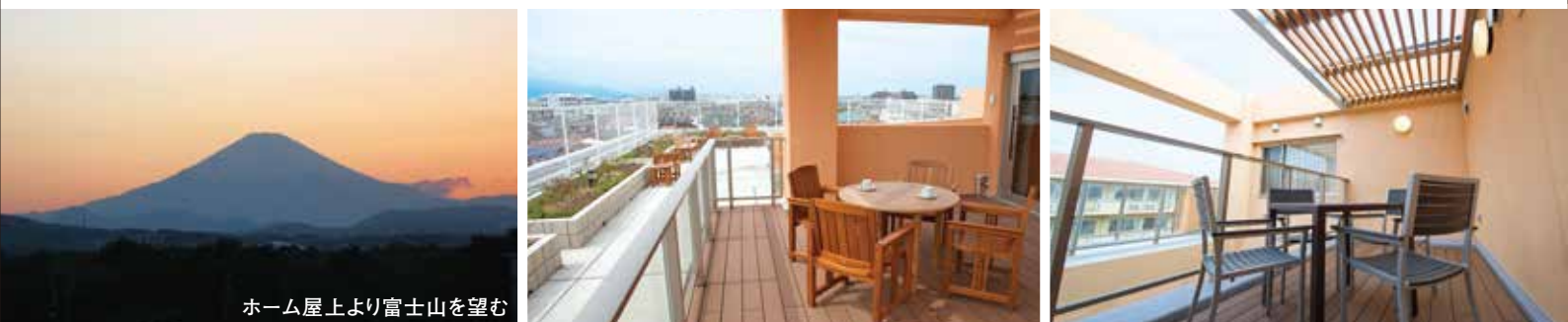
ホーム屋上より富士山を望む