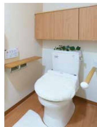
車椅子でも使いやすいトイレ