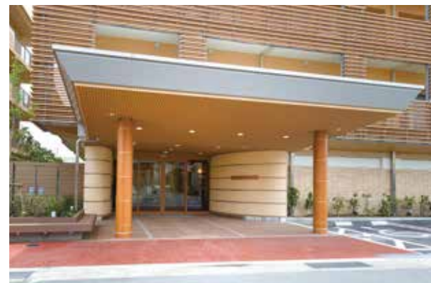
ここに住まう方々やご家族を優雅に出迎えるエントランス ※建物写真は平成23年6月撮影 / 建物:賃借

日本有数の別荘地としての文化と歴史を誇る湘南エリア。 温暖な気候と開放的な住環境が魅力の地に 「SOMPOケア ラヴィーレ湘南平塚式番館」があります。 広々とした屋上テラスからは壮大な富士山を望め、 上品で心地良い共用空間では ご入居者さま同士の楽しい会話が弾みます。 癒しに満ちた快適なホームで、 心からくつろげる日常をお愉しみください。