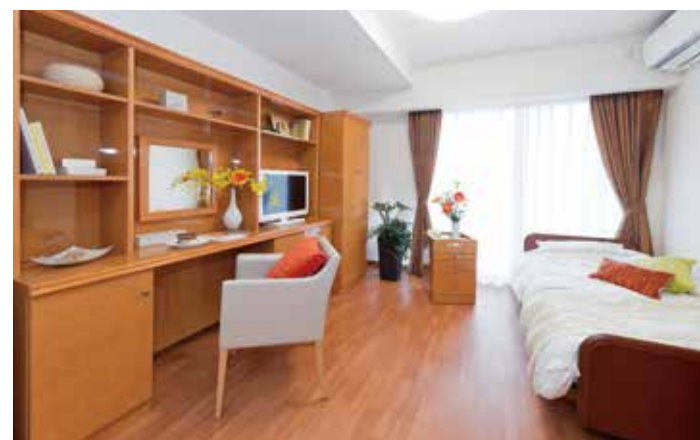
お気に入りの家具を持ち込める居室（モデルルーム）

安心してお過ごしいただけるよう、緊急コールを各室とトイレに設置し、 車椅子のご利用にも配慮しています。