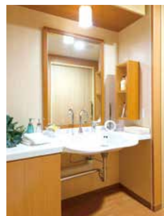
清潔感のある洗面化粧台を各室に設置