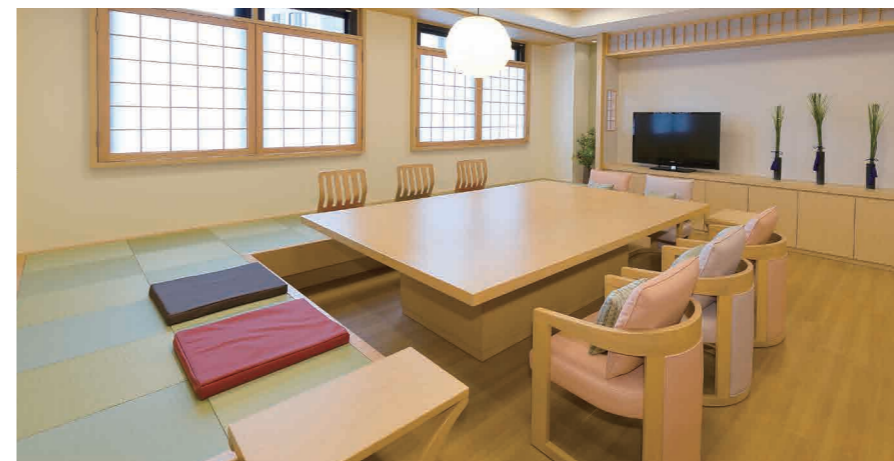
ご入居者さまの憩いの場となるラウンジ

窓の大きなダイニング(食堂)や各階に設けたラウンジをはじめ、日常的にゆとりと癒しを実感できる共用空間・設備をご用意しています。