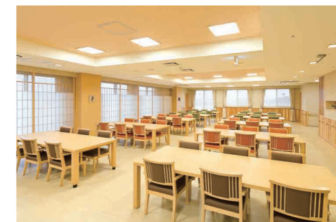
大きな窓に面し明るさいっぱいのダイニング(食堂)