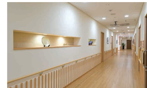
和の趣を感じる室内

「ゆしみながら暮らす」が似合う街、南町田。 開放感と和の趣が魅力の心地よい暮らしが始まります。