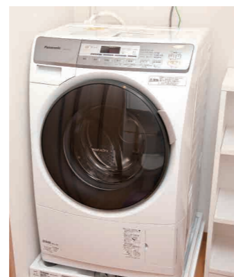
全室に全自動洗濯機を設置