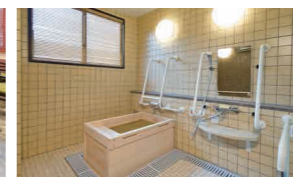
ゆったりとした気分で入れるヒノキ風呂