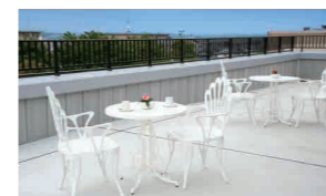
周辺の眺望も楽しめる開放感いっぱいの屋上テラス