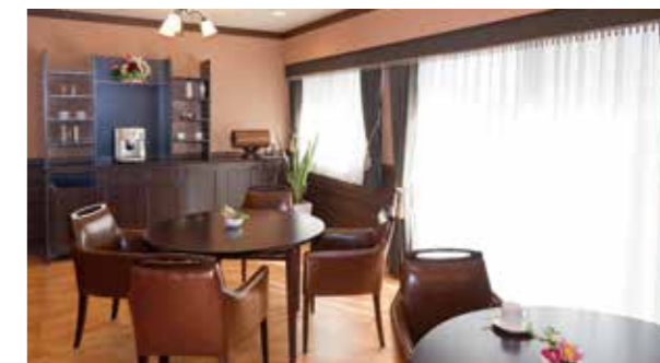
思い思いにお過ごしいただけるカフェ