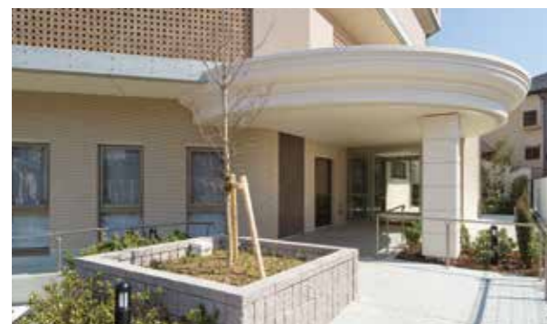
ここに住まう方々やご家族を優雅に出迎えるエントランス ※建物写真は平成23年3月撮影/建物:賃借

便利さとゆとりが魅力の好立地に誕生。 安心・安全にこだわった、ご入居者さま想いのホームです。