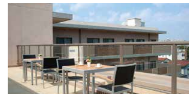
明るく開放感のある屋上テラスからは周辺の眺望も満喫

便利さとゆとりが魅力の好立地に誕生。 安心・安全にこだわった、ご入居者さま想いのホームです。