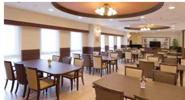
広々としたダイニングなど、ご入居者さまに心地よくお過ごしいただける共用スペース

窓の大きなダイニング(食堂)や各階に設けたラウンジをはじめ、日常的にゆとりと癒しを実感できる共用空間・設備をご用意しています。