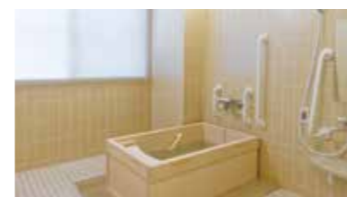
ゆったりとした気分で入れるヒノキ風呂