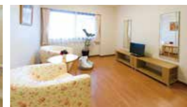
リラックスしていただくためのコーナーをご用意