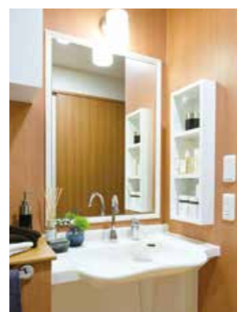
清潔感のある洗面化粧台を各室に設置