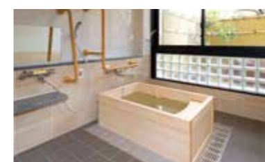
ゆったりとした気分に入れるヒノキ風呂