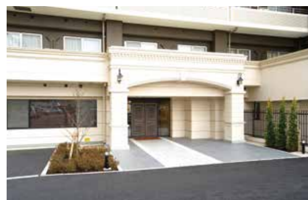
ここに住まう方々やご家族を優雅に出迎えるエントランス ※建物写真は平成23年2月撮影 / 建物: 賃借

公園や街路樹など、窓外に広がる緑を愉しむ、 穏やかで彩り豊かな毎日が始まります。