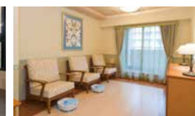
リラックスしていただくためのコーナーをご用意