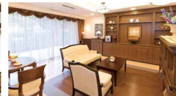
思い思いにお過ごしいただけるカフェ