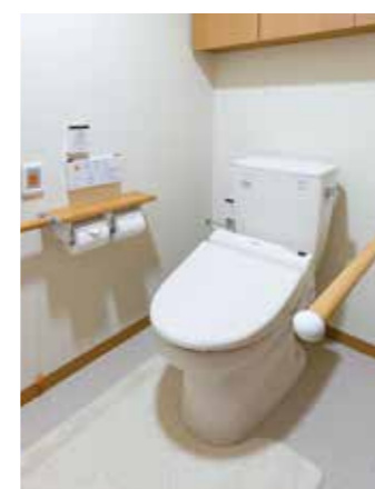
車椅子でも使いやすいトイレ

昨日より今日、今日より明日と、笑顔の数がひとつでも増えていくように。 お一人おひとりにとって本当にうれしい介護をカタチにしていまいます。