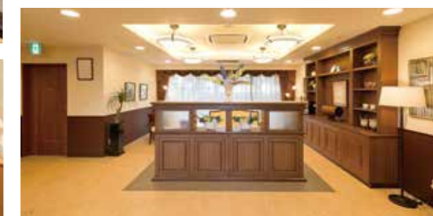
ご入居者さまや訪問されたご家族をゆったりと迎え入れるエントランスロビー

公園や街路樹など、窓外に広がる緑を愉しむ、 穏やかで彩り豊かな毎日が始まります。