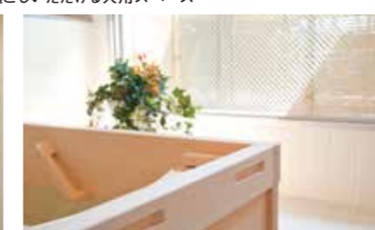
ゆったりとした気分で入れるヒノキ風呂