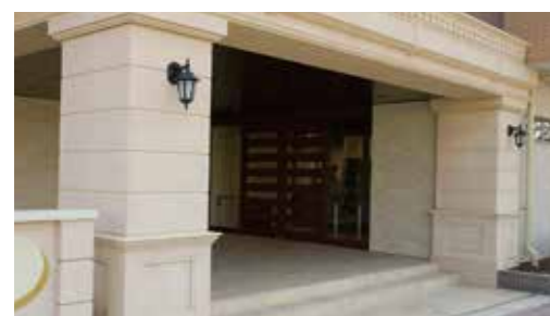
ここに住まう方々やご家族を優雅に出迎えるエントランス ※建物写真は平成23年2月撮影 / 建物:賃借

都心直結の2駅6路線が利用できる利便性に加え、広大な赤羽自然観察公園隣接の開放感も満喫できる「SOMPOケア ラヴィーレ赤羽」。 落ち着いた色調の、どこか懐かしい雰囲気の内からは公園側の気持ちのいい風景や、春には目の前の桜並木も愉しめます。 広々としたつくりの上質な空間で、四季を愉しむ暮らしが始まります。