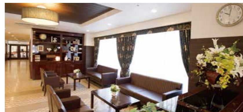
開放的なラウンジをはじめご入居者さまに心地よくお過ごしいただける共用スペース

ゆったりとしたダイニング(食堂)や思い思いに過ごせるカフェなど、日常的にゆとりと癒しを実感できる共用空間・設備をご用意しています。