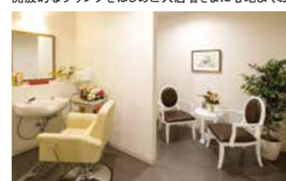
いつまでも美しくいていただくための理美容室