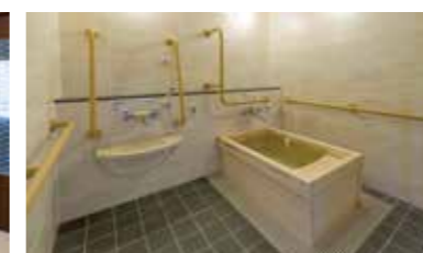
ゆったりとした気分に入れるヒノキ風呂