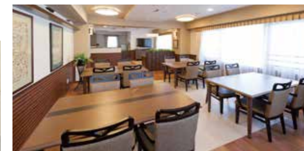
大きな窓に面し明るさいっぱいのダイニング(食堂)

昨日より今日、今日より明日と、笑顔の数がひとつでも増えていくように。 お一人おひとりにとって本当にうれしい介護をカタチにしていまいます。