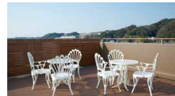
大空と眺望を楽しめる屋上テラス