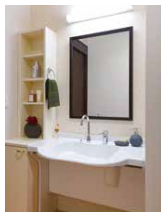
清潔感のある洗面化粧台を各居室に設置