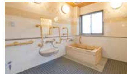
ゆったりとした気分に入れるヒノキ風呂