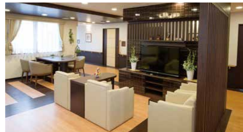
ご入居者さまに心地よくお過ごしいただける共用スペース

ゆったりとしたダイニング(食堂)や思い思いに過ごせるカフェなど、日常的にゆとりと癒しを実感できる共用空間・設備をご用意しています。