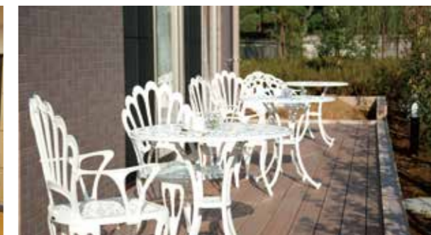
ご入居者さま同士の会話やティータイム、読書などを楽しめる開放感いっぱいのウッドデッキテラス