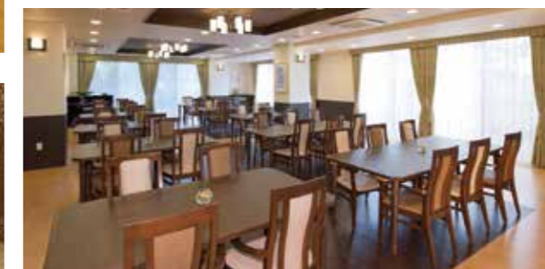
二面採光で明るく美しいダイニング(食堂)

昨日より今日、今日より明日と、笑顔の数がひとつでも増えていくように。お一人おひとりにとって本当にうれしい介護をカタチにまいります。