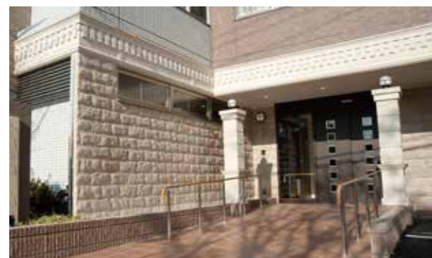
ここに住まう方々やご家族を優雅に出迎えるエントランス ※建物写真は平成22年12月撮影 / 建物:賃借

埼京線「戸田」駅徒歩9分。都心の賑わいを愉しみながら、自然の潤いに癒される、表情豊かな暮らしが、ここから始まります。