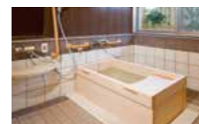
ゆったりとした気分に入れるヒノキ風呂