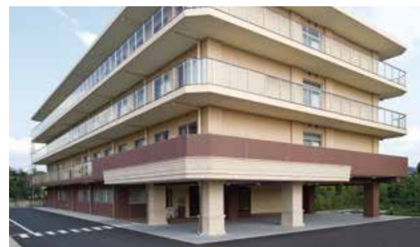
ここに住まう方々やご家族を優雅に迎えるエントランス ※建物写真は2010年10月撮影/建物:賃借

賑わいと落ち着きが調和する街「南浦和」。この街ならではの 大空と緑に彩られた、開放感あふれる毎日が、今始まります。