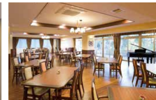
二面採光で明るさいっぱいのダイニング(食堂)