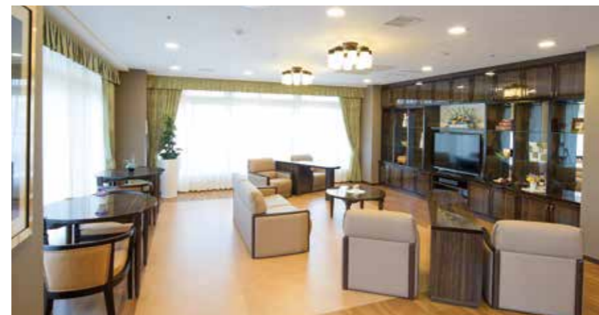
開放的なラウンジをはじめご入居者さまに心地よくお過ごしいただける共用スペース

窓の大きなダイニング(食堂)や各階に設けたラウンジをはじめ、日常的にゆとりと癒しを実感できる共用空間・設備をご用意しています。