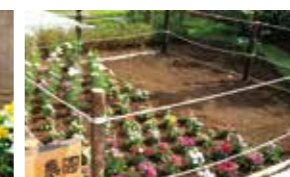
広々とした庭の一角、日当たりの良い場所に設けた農園

賑わいと落ち着きが調和する街「南浦和」。この街ならではの 大空と緑に彩られた、開放感あふれる毎日が、今始まります。