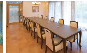
訪問されたご家族と和やかなひとときを 過ごせるファミリーダイニング