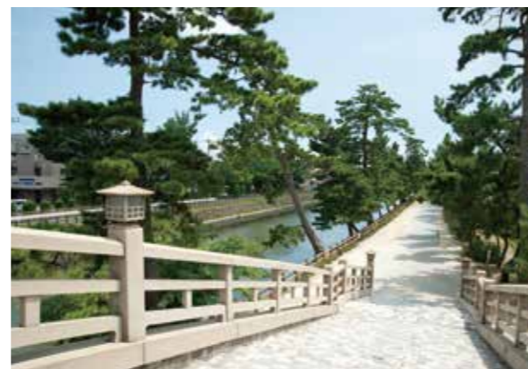
「日本の道100選」に選ばれている松原遊歩道(現地より約700m)