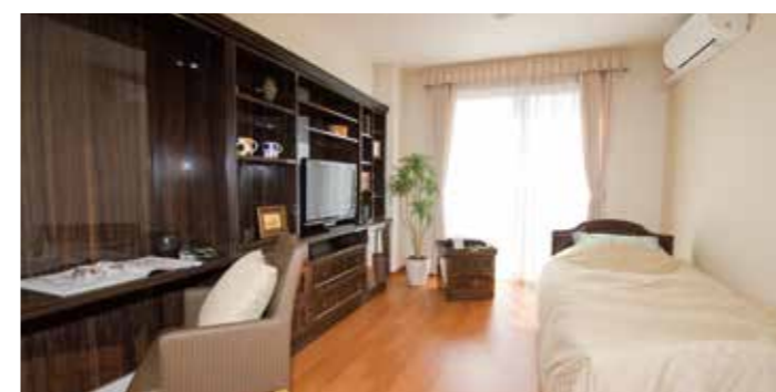
居室(モデルルーム)

お気に入りの家具を持ち込んでいただき、ご自分らしいインテリアで楽しんでいただける居室。たっぷり入る収納庫も備えております。安心してお過ごしいただけるよう、緊急コールを各室、トイレに設置し、車椅子の利用にも配慮しています。