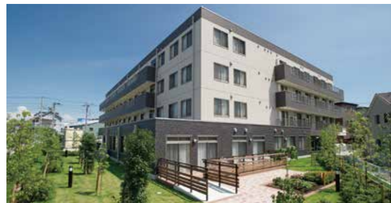
外観(平成22年8月撮影/建物・賃借)

旧日光街道屈指の宿場町であった「草加」。江戸時代から続く松並木など、歴史と自然が調和した美しい街に佇む「SOMPOケア ラヴィーレ草加松原」。旅籠のイメージを採り入れた格調高いデザインのホームは、開放的で癒しを感じる工夫がたくさん。穏やかな毎日をお過ごしいただけます。