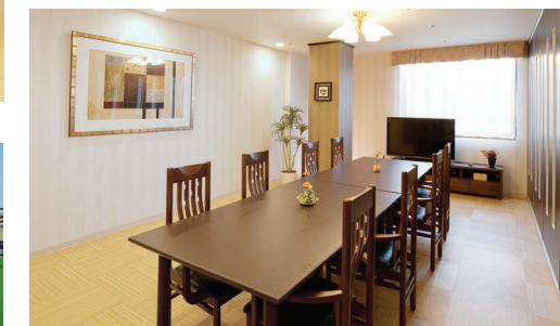
訪問されたご家族と和やかなひとときを過ごせるファミリーダイニング

水と緑に恵まれた街、越谷の閑静な住宅街。 元荒川の桜堤や夏の花火大会が楽しめます。