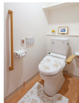
車椅子でも使いやすいトイレ

昨日より今日、今日より明日と、笑顔の数がひとつでも増えていくように。 お一人おひとりにとって本当にうれしい介護をカタチにしていまいます。