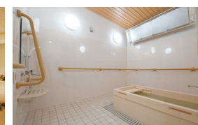
ゆったりとした気分で入れるヒノキ風呂