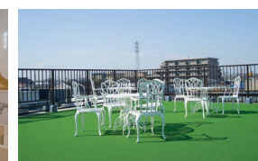
大空と眺望を楽しめる屋上