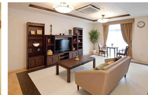
思い思いにお過ごしいただけるラウンジ