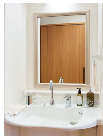
清潔感のある洗面化粧台を各室に設置