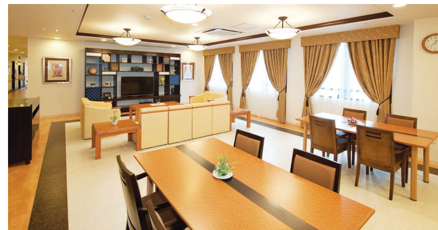
ご入居者さまに心地よく過ごしていただける共用スペース

窓の大きなダイニング(食堂)や各階に設けたラウンジをはじめ、日常的にゆとりと癒しを実感できる共用空間・設備をご用意しています。