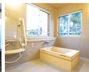
ゆったりとした気分に入れるヒノキ風呂