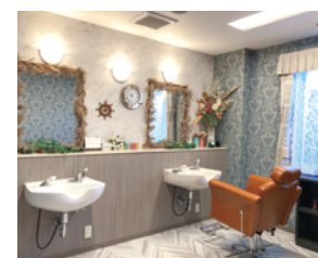
いつまでも美しくいていただくための理美容室