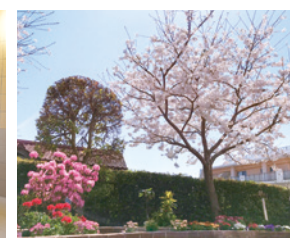
四季折々の花に彩られた中庭