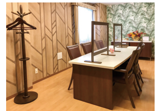
明るく落ち着いた雰囲気の相談室