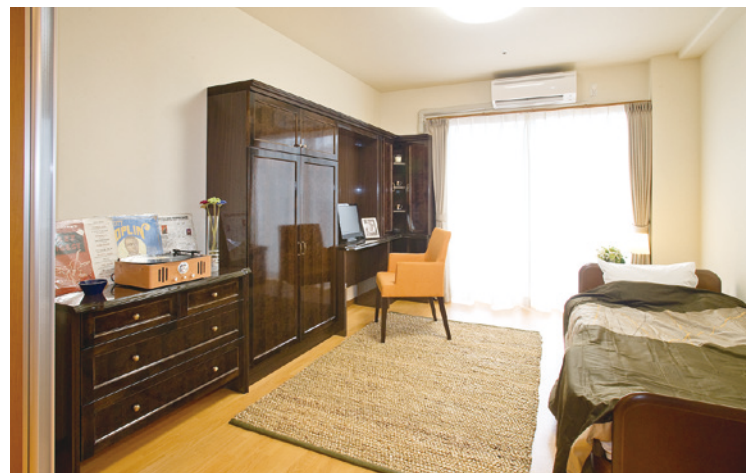
お気に入りの家具を持ち込める居室（モデルルーム）

安心してお過ごしいただけるよう、 緊急コールを各室とトイレに設置し、 車椅子のご利用にも配慮しています。