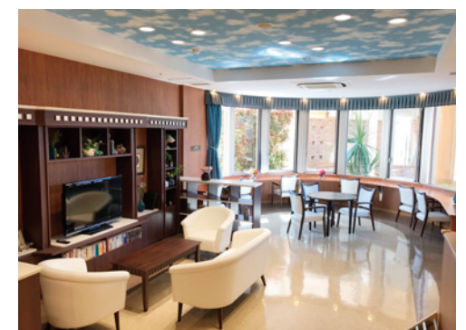
思い思いにお過ごしいただけるカフェ

昨日より今日、今日より明日と、笑顔の数がひとつでも増えていくように。 お一人おひとりにとって本当にうれしい介護をカタチにしていまいます。