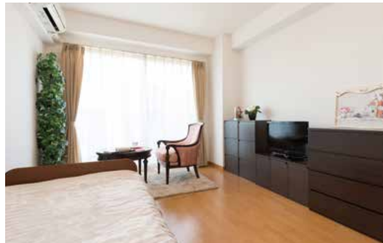
お気に入りの家具を持ち込める居室（モデルルーム）

安心してお過ごしいただけるよう、緊急コールを各室とトイレに設置し、車椅子のご利用にも配慮しています。