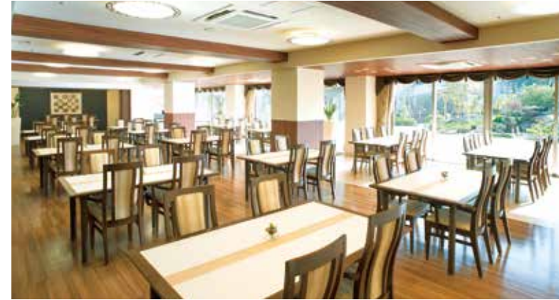
大きな窓から陽光が差し込む、明るさいっぱいのダイニング

ゆったりとしたダイニング（食堂）や思い思いに過ごせるカフェなど、日常的にゆとりと癒しを実感できる共用空間・設備をご用意しています。