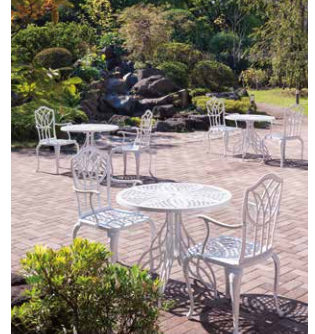
ご入居者さま同士での会話やティータイム、読書などを楽しめる開放感いっぱいのテラス