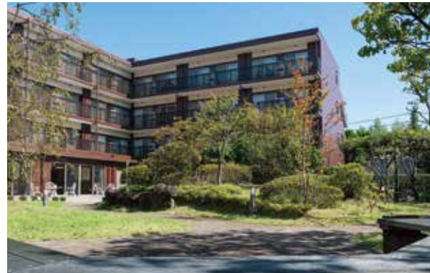
中庭 ※建物写真は平成29年11月撮影／建物・賃借

隣接する児童公園を借景に、端然と広がる本格的な日本庭園が魅力の「SOMPOケア ラヴィーレ海老名」。 70人のご入居者さまに合わせて70種70本の樹木をご用意するなど、庭園を日々楽しんでいただけます。 もちろん、インテリアや住空間のゆとりにも配慮。 気の合うお仲間とともに喜びに満ちた暮らしを始めてください。