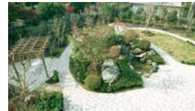
心身を癒す緑いっぱいの庭園