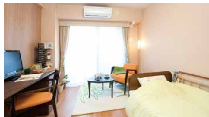
居室(モデルルーム)

お気に入りの家具を持ち込んでいただき、ご自分らしいインテリアで楽しんでいただける居室。安心してお過ごしいただけるよう、緊急コールを各室に設置しております。