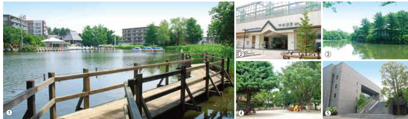
①都立石神井公園 ②中村橋駅 ③巖島神社 ④中村公園 ⑤練馬区立美術館

都心へのアクセスが至便でありながら武蔵野の面影を強く残す街、中村橋。「都立石神井公園」は、石神井池から三宝寺池にかけて豊かな自然が広がり、住民の憩いの場となっています。「石神井城跡」「巖島神社」「南蔵院」などの歴史遺産や、美術館も点在し、街に深い趣を添えています。日常のお買い物は近隣の「いなげや」をはじめ、中村橋駅前の「サンツ中村橋商店街」がサポート。自然のうらおいと利便性を享受する豊かな生活環境です。