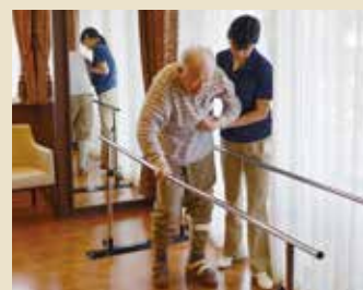
リハビリの様子(イメージ)