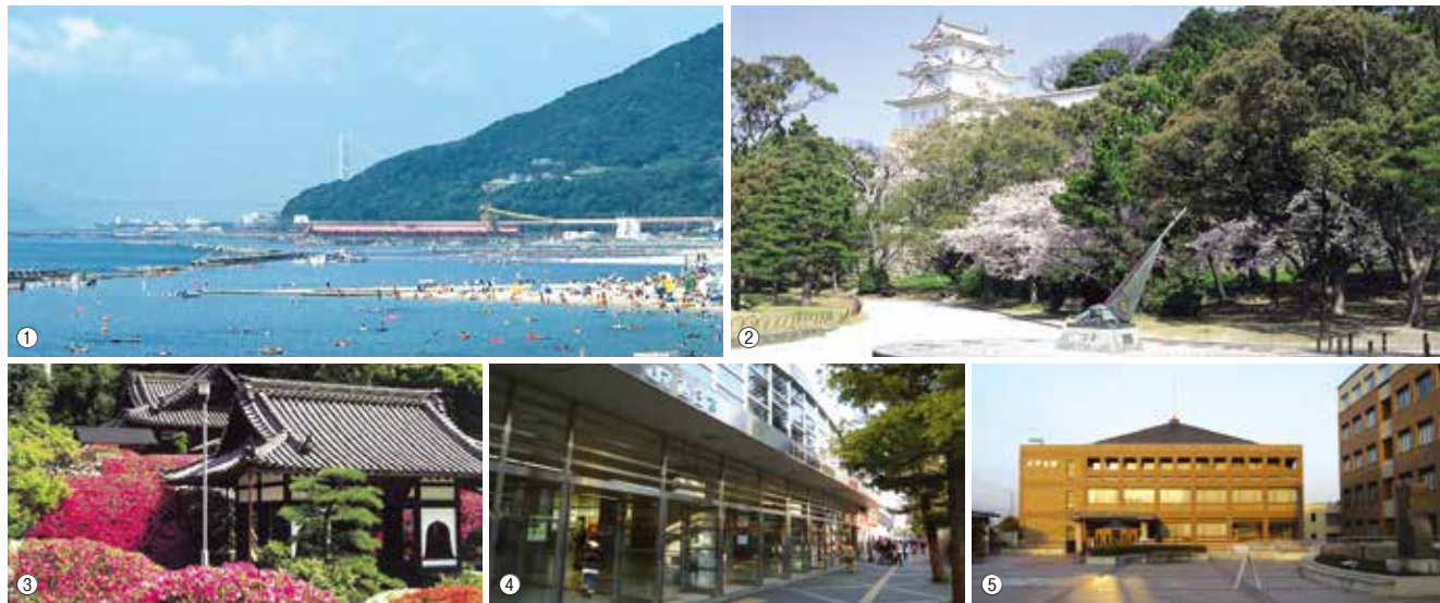
①須磨海浜公園 ②明石公園 (C)明石観光協会 ③本松寺・妙見社のツツジ (C)明石観光協会 ④明石駅 ⑤神戸学院大学 有瀬キャンパス

源氏物語の舞台として有名な、須磨・明石。千年の時を超えて、その美しい自然や季節感は日本人の心に訴えかけます。 伊川谷は、神戸のベッドタウンとして人気の高い、西神戸丘陵の南端「大蔵谷」に続く地域です。 ホーム近隣には、神戸学院大学キャンパスをはじめ各種専門店が点在し、利便性にも優れた快適な生活環境です。