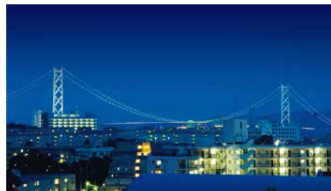
ホームより明石海峡大橋を望む

上質なりゾートホテルのような趣を感じさせる SOMPOケア ラヴィーレ神戸伊川谷は、 ゆったりとした時の流れと 緑あふれる景観を享受しています。 ダイニングや大浴場からは、 明石海峡大橋を望むことができます。 ミニキッチン付きのラウンジや、 ルーフバルコニーを眺める事のできる、 奥行き感のあるダイニングなど共用設備も充実しています。