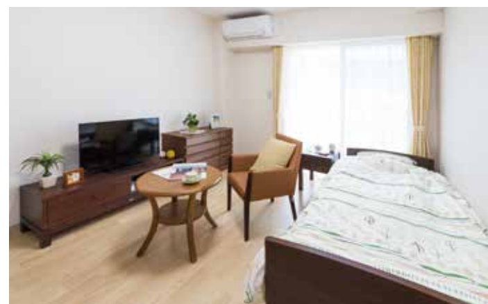
お気に入りの家具を持ち込める居室（モデルルーム）

毎日、快適にお過ごしいただくために、広々と使える居室をご用意。 各室には、緊急コールを設置。安心・安全にも徹底的に配慮しています。