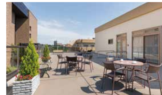
さわやかな風につつまれるルーフバルコニー