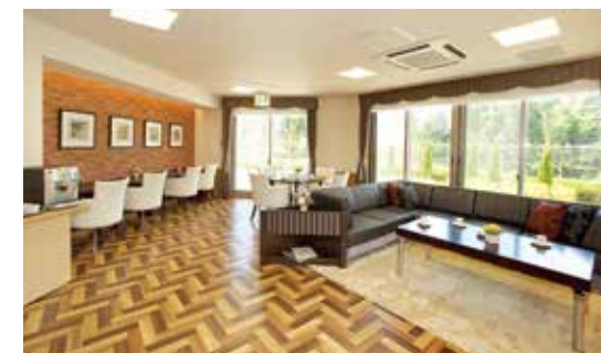
歓談や読書など思い思いにお過ごしいただけるカフェ