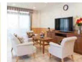
ご入居者さまどうしでの 会話を弾むラウンジ