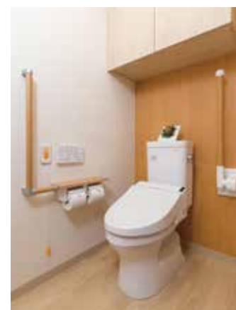
車椅子でも使いやすいトイレ