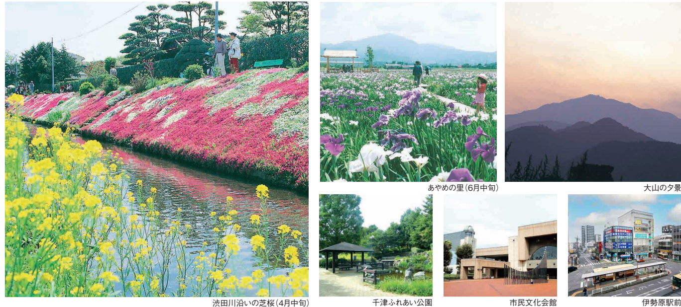
渋田川沿いの芝桜(4月中旬) 千津ふれあい公園 市民文化会館 伊勢原駅前

大山詣の地として古くから栄え、風情ある景色を今なお残す街、伊勢原。雄大な霊峰大山の眺望や、渋田川の芝桜、あやめの里など、四季を通じて様々な景色が楽しめます。ホームそばの千津ふれあい公園は、格好のお散歩コース。昔ながらの商店街がのびる「伊勢原」駅も近く、自然のうらおいと利便性を享受する、快適な生活環境です。