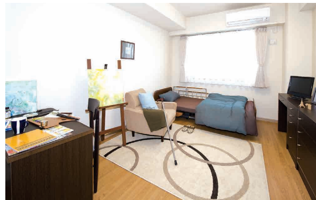
居室(モデルルーム) ※居室変更については、「入居についてのご案内」の「居室変更」欄に記載があります。

+ 24h 夜間の緊急時も安心 夜間に体調が崩れたりしても適切な処置を施し、緊急時でも迅速な対応で医療機関との連携を行います。専門技術を持った看護スタッフがご入居者さまのそばで見守っています。