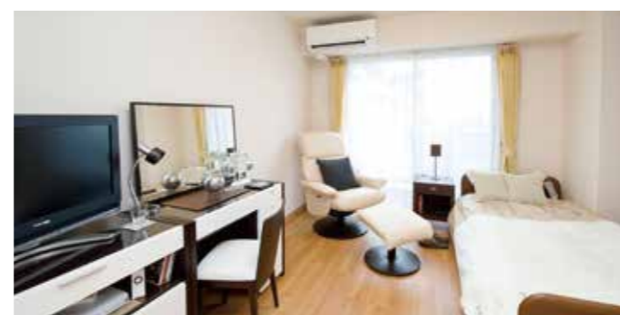
居室(モデルルーム)

お気に入りの家具を持ち込んでいただき、ご自分らしいインテリア で楽しんでいただける居室。たっぷり入る収納庫も備えておりま す。安心してお過ごしいただけるよう、緊急コールを各室、トイレに 設置し、車椅子の利用にも配慮しています。