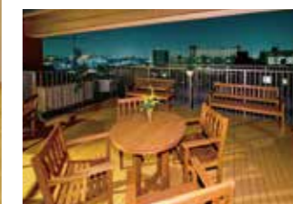
屋上ウッドデッキテラス