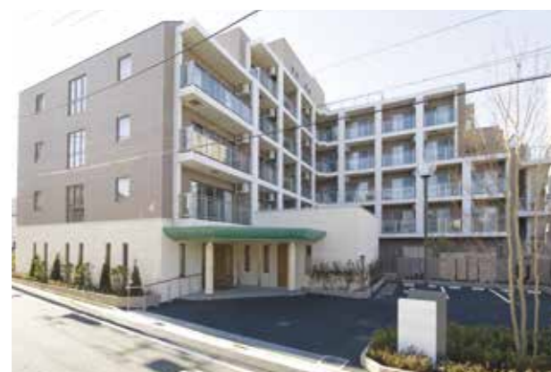
外観(平成20年3月撮影/建物・賃借)

高級感あふれる重厚な雰囲気のアプローチ。都会的で端正な外観。大きな窓のあるダイニングや各階のウッドデッキテラスなど、やわらかな光とさわやかな風に満たされ、心地よい開放感にあふれています。近隣には「希望丘公園」や「芦花公園」など緑が多く、世田谷らしい落ち着いた暮らしをお楽しみいただけます。