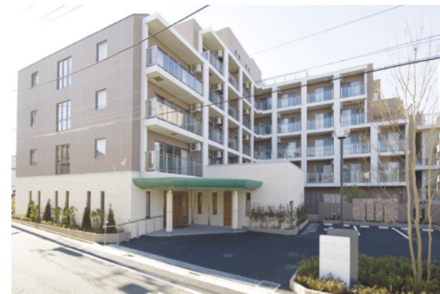
外観(平成20年3月撮影/建物・賃借)

高級感あふれる重厚な雰囲気のアプローチ。都会的で端正な外観。大きな窓のあるダイニングや各階のウッドデッキテラスなど、やわらかな光とさわやかな風に満たされ、心地よい開放感にあふれています。近隣には「希望丘公園」や「芦花公園」など緑が多く、世田谷らしい落ち着いた暮らしをお楽しみいただけます。