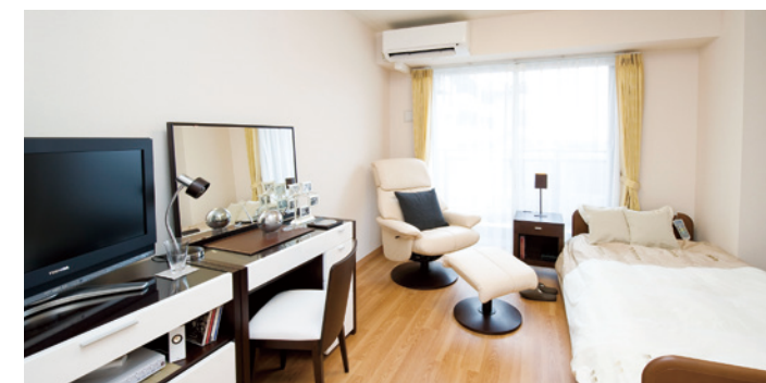
居室(モデルルーム)

お気に入りの家具を持ち込んでいただき、ご自分らしいインテリア で楽しんでいただける居室。たっぷりとする収納庫も備えておりま す。安心してお過ごしいただけるよう、緊急コールを各室、トイレに 設置し、車椅子の利用にも配慮しています。