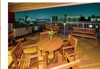
屋上ウッドデッキテラス