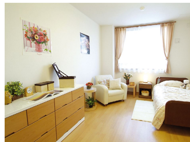
居室(モデルルーム) ※居室変更については、「入居についてのご案内」の「居室変更」欄に記載があります。