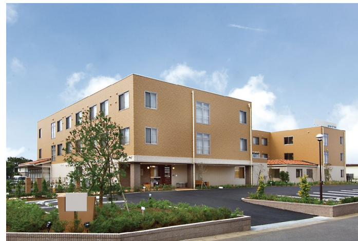
外観(平成19年10月撮影/建物:賃借)

洒落たレンガ調の支柱が印象的なゲートと明るい色彩の外観。豊かな植栽に彩られたアプローチが、住まう方をやさしく出迎えてくれます。四方向から楽しめる中庭には、心地よい開放感があふれています。