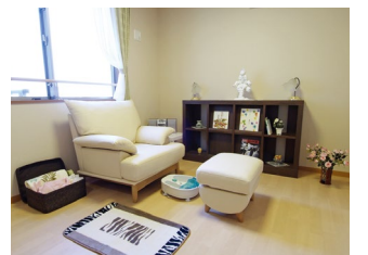
マッサージルーム