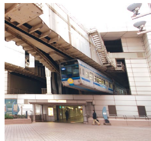
千葉都市モノレール