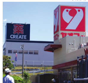
ホーム前スーパー

「東京」へ約59分、「千葉」へ約13分の快適アクセス。「穴川IC」からも約2.9kmの便利な立地。