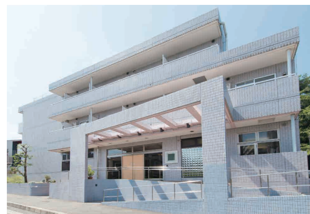
ここに住まう方々やご家族を優雅に出迎えるエントランス ※建物写真は平成24年9月撮影/建物:賃借

ステンドグラスがあしらわれた優しい光が差し込む食堂や毎日の暮らしにやすらぎを与える多彩な共用部が魅力の「SOMPOケア ラヴィーレ溝の口式番館」。 カフェやラウンジなど、落ち着きのある一時をもたらす快適なくつろぎ空間が各所に用意されているので、いきいきとした健やかな日々をお過ごしいただけます。