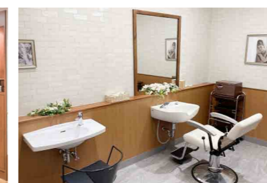
いつまでも美しくいていただくための理美容室