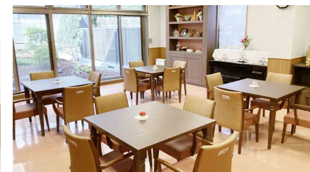
ご入居者さまの憩いの場となるラウンジ