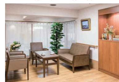
明るく落ち着いた雰囲気の談話スペース