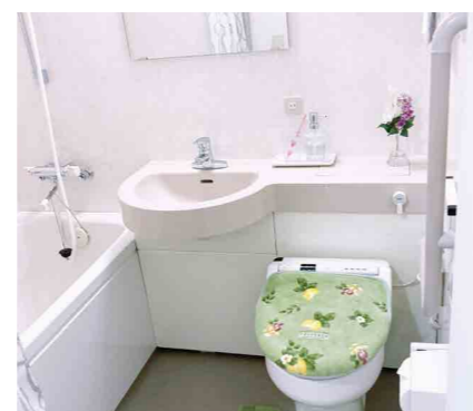
プライバシーに配慮したユニットバス

安心してお過ごしいただけるよう、緊急コールを各室とトイレに設置し、車椅子のご利用にも配慮しています。