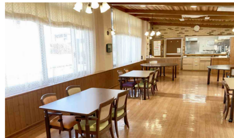
大きな窓から陽光が差し込む明るい食堂

ゆったりとしたダイニング(食堂)や思い思いに過ごせるカフェなど、日常的にゆとりと癒しを実感できる共用空間・設備をご用意しています。