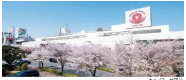
たまプラーザ駅前