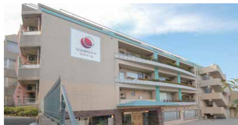
外観(平成30年2月撮影/建物・賃借)

SOMPOケア ラヴィーレあざみ野は、豊かな緑に恵まれた、小高い丘の上に建つモダンな建物。四季折々の移ろいを楽しめる中庭の植栽、降り注ぐやわらかな光とさわやかな風、建具の木のぬくもりなど、森の中にいるような、自然とくつろぎを五感で味わっていただけるホームです。落ち着きのある豊かな暮らしがここからはじまります。