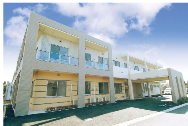
外観(平成19年3月撮影/建物:賃借)

パステル調のオレンジが映える、明るい雰囲気の外観。住まう方々へくつろぎを提供すると共に、おもてなしの空間としてもお使いいただけるエントランスロビーや豊かな緑と陽光に満たされたウッドデッキテラスなど、やわらかな光とさわやかな風に包まれ、心地よい開放感にあふれています。