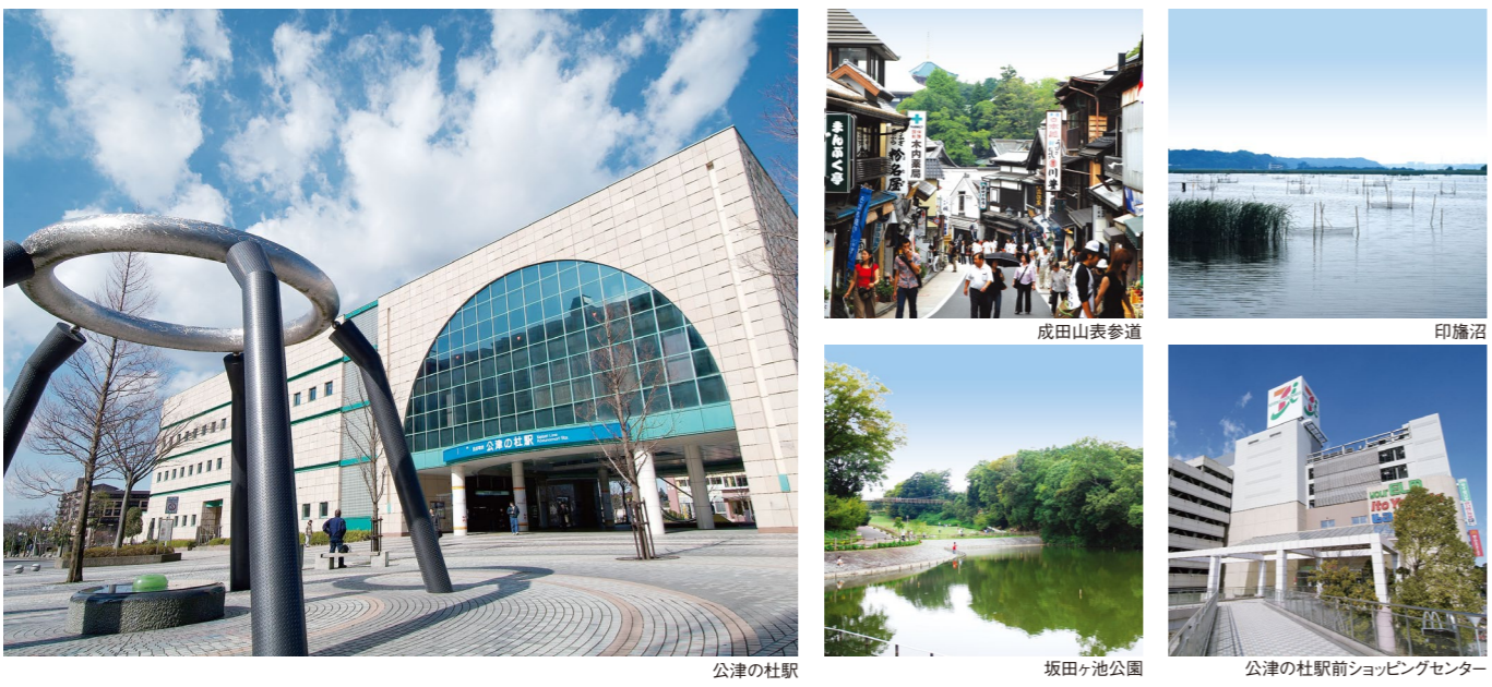
公津の杜駅 成田山表参道 印旛沼 坂田ヶ池公園 公津の杜駅前ショッピングセンター

豊かな自然、御守りの地、便利な駅前立地。バランスのとれた「公津の杜」の暮らし。 東京からおよそ1時間。モダンな美しい街並みが広がる公津の杜。駅前には、ユアエルムショッピングセンターをはじめ、生活利便施設も充実。東の方角には名刹 成田山新勝寺を控え、西の方角には印旛沼湖岸の豊かな田園風景や、整備された自然公園が点在しています。四季折々の風情と、駅前の利便さを兼ね備えた、豊かで快適な生活環境です。