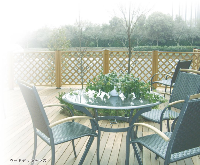
ウッドデッキテラス