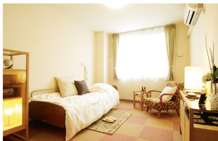
居室(モデルルーム) ※居室変更については、「入居についてのご案内」の「居室変更」欄に記載があります。

お気に入りの家具を持ち込んでいただき、ご自分らしいインテリアで楽しんでいただける居室。安心してお過ごしいただけるよう、緊急コールを各室、トイレに設置し、車椅子の利用にも配慮しています。