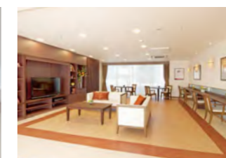
思い思いにお過ごしいただけるカフェ