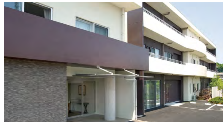
※建物写真は2010年6月撮影/土地建物権利関係:事業主体非所有

SOMPOケア ラヴィーレ座間谷戸山公園は神奈川県屈指の自然公園「座間谷戸山公園」に程近い、緑あふれる環境に立地します。 中庭や吹抜けのあるエントランスロビー、風を感じる屋上テラスなど、開放的な雰囲気が心地よいホームです。 快適に満たされた豊かな暮らしがここから始まります。