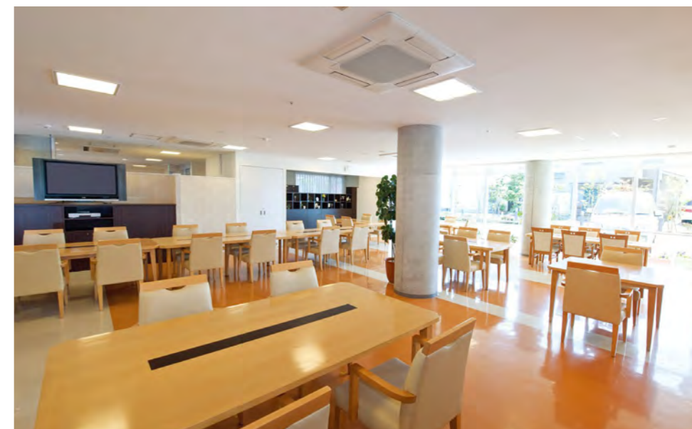
大きな窓から陽光が差し込む、明るさいっぱいのダイニング

中庭に面したダイニング(食堂)や エントランスロビー、各階に設けた ラウンジなど、日常的にゆとりと癒し を実感できる共用空間・設備を ご用意しています。 ご入居の方々との憩いの時間も、 おひとりでゆっくり楽しむ時間も、 まるで“わが家”のようにお過ごし いただけます。