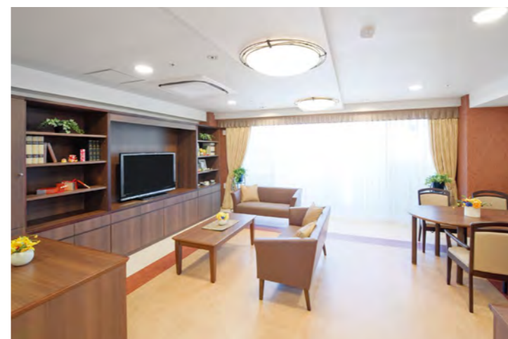
開放的なラウンジをはじめご入居者さまに心地よくお過ごしいただける共用スペース