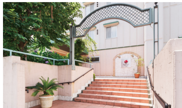
ここに住もう方々やご家族を優雅に出迎えるエントランス ※建物写真は平成28年7月撮影／建物：賃借

駅近の利便性と住宅地ならではの落ち着いた雰囲気をも併せ持つ 光と緑に満たされた豊かな暮らし。