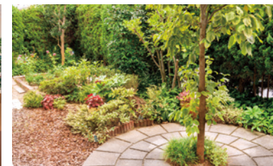
四季折々の彩りを楽しめる庭園