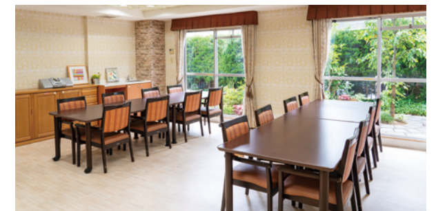
ご家族とのひとときをお楽しみいただけるファミリーダイニング

昨日より今日、今日より明日と、笑顔の数がひとつでも増えていくように。 お一人おひとりにとって本当にうれしい介護をカタチにまいります。