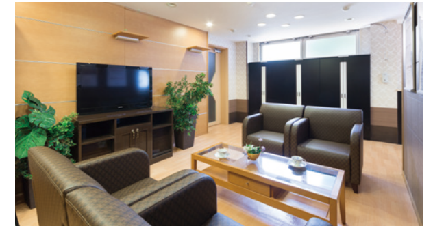
思い思いにお過ごしいただけるラウンジ