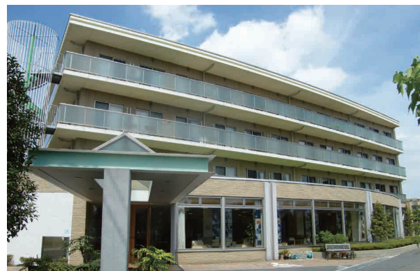
外観(平成20年8月撮影/建物:賃借)

奥行きあるエントランスアプローチに、道に沿うようなやさしいカーブの窓が印象的な外観フォルム。 開放的なエントランスロビーが、住まう方々へくつろぎを与えると共に、おもてなしの空間として、 あたたかくお迎えいたします。