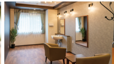
いつまでもお洒落でいられるための理美容室