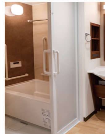
手すりなどが設置されていて使いやすい浴室

昨日より今日、今日より明日と、笑顔の数がひとつでも増えていくように。お一人おひとりにとって本当にうれしい介護をカタチにしていまいます。