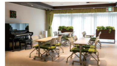
地域交流で活用できるコミュニティスペース