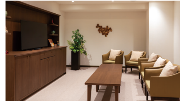
ご入居者さまの憩いの場となる多目的スペース