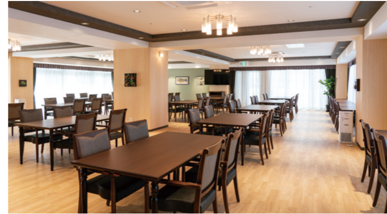
広々とした明るいダイニング。心地よくお過ごしいただける共用スペース

憩いの時間を過ごすラウンジや多目的スペース、ウッドデッキテラスなど日常的にゆとりと癒しを実感できる上質感あふれる共用空間をご用意。