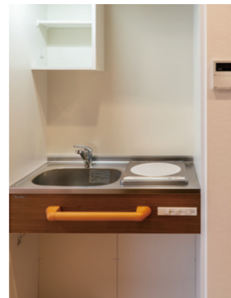
使い勝手の良いミニキッチン