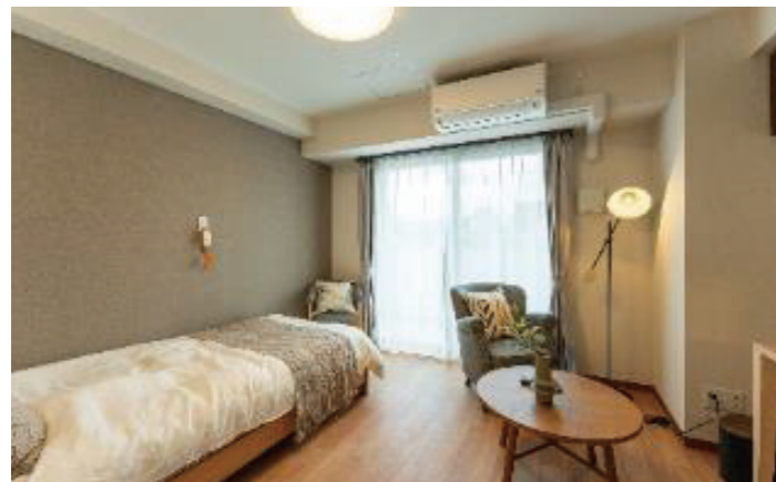
お気に入りの家具を持ち込める居室 ※イメージ画像です

毎日お過ごしいただく居室は28㎡程度の広さを確保。安心してお過ごしいただく居室には緊急コールを各室とトイレに設置。全居室に浴室・トイレ・ミニキッチン・洗濯機置き場・インターネット回線（フリーWi-Fi）完備。 ※電話個別契約となります。