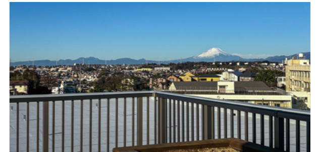
屋上には富士山を眺められるウッドデッキスペース