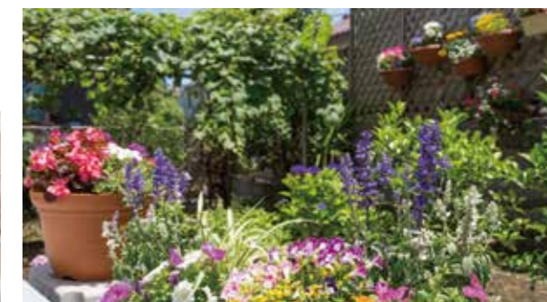
四季折々の風情が楽しめる花壇