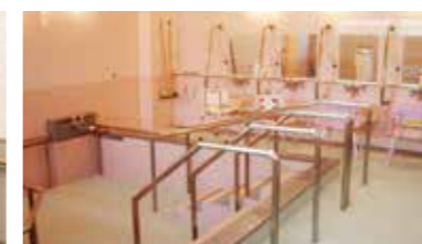
ゆったりとした気分で入れる大浴場