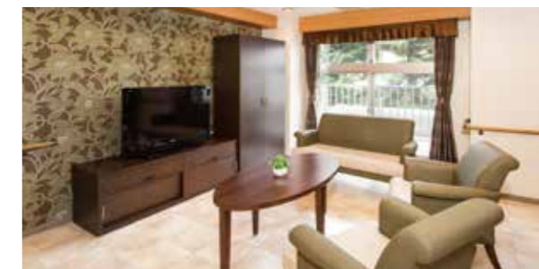
ご入居者さまどうしでの会話も弾むラウンジ