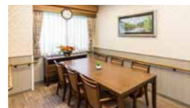
訪問されたご家族と和やかなひとときを過ごせる応接室