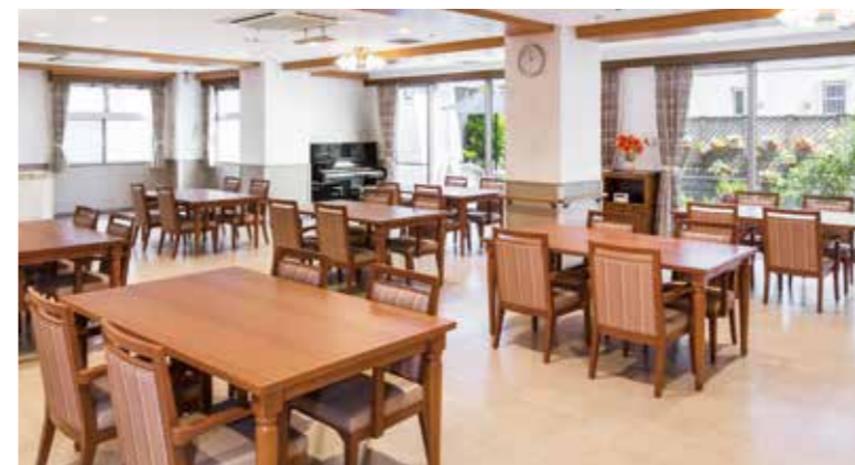
南向きの大きな窓から陽光が差し込む、明るさいっぱいのダイニング

ゆったりとしたダイニング(食堂)や思い思いに過ごせるラウンジ。日常的にゆとりと癒しを実感できる共用空間・設備をご用意しています。