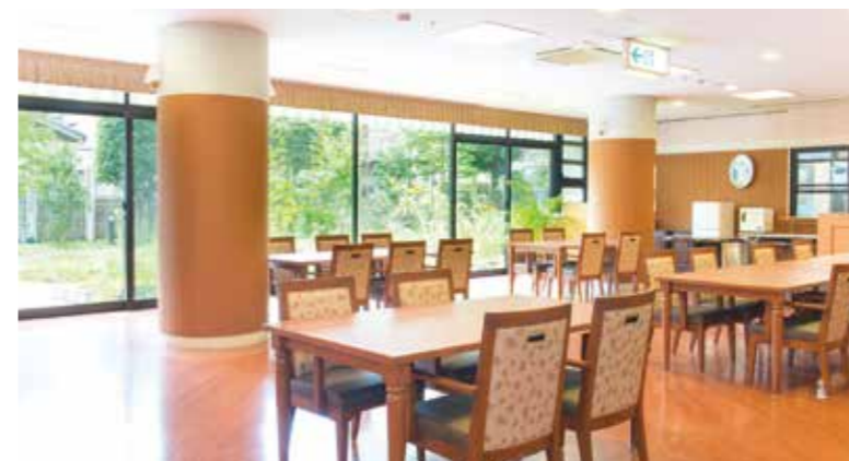
明るさいっぱいのダイニングをはじめご入居者さまに心地よくお過ごしいただける共用スペース

ゆったりとしたダイニング(食堂)や思い思いに過ごせるカフェなど、日常的にゆとりと癒しを実感できる共用空間・設備をご用意しています。