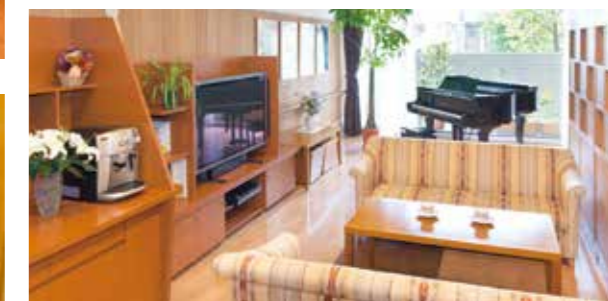
落ち着いた雰囲気でも心地よいカフェ

バラのアーチ、色とりどりの草花。 鮮やかに彩られた庭園で、四季の移ろいを愉しむ暮らしを。