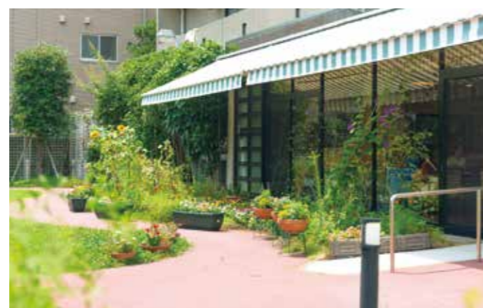
陽光やそよ風が気持ちよい中庭

昨日より今日、今日より明日と、笑顔の数がひとつでも増えていくように。 お一人おひとりにとって本当にうれしい介護をカタチにしていまいます。