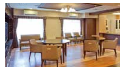
落ち着いたラウンジをはじめご入居者さまに心地よくお過ごしいただける共用スペース