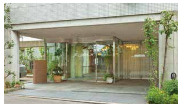
ここに住まう方々やご家族を優雅に出迎えるエントランス ※建物写真は平成24年8月撮影/建物:賃借

江戸時代、厚木は大山街道の宿場町として栄えました。その閑静な住宅地に佇む「SOMPOケア ラヴィーレ厚木」。相模川が静かにせせらぐ、やすらぎに満ちた住環境です。ホームには、全面ガラス張りの広々としたダイニング。やわらかな陽の光を感じながら、心地良く、お食事やお茶をお愉しみいただけます。穏やかな、憩いの毎日を、ここ厚木でお過ごしください。