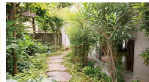
豊かな緑に満たされた庭