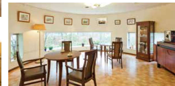
思い思いにお過ごしいただけるカフェ