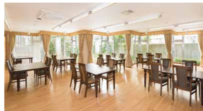
大きな窓から陽光が差し込む、明るさいっぱいのダイニング

ゆったりとしたダイニング(食堂)や思い思いに過ごせるカフェなど、日常的にゆとりと癒しを実感できる共用空間・設備をご用意しています。