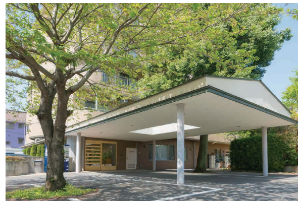
ここに住まう方々やご家族を優雅に出迎えるエントランス ※建物写真は平成25年4月撮影/建物:賃借

都心からのアクセスがよく、東武東上線「ふじみ野」駅からも徒歩4分。そんな利便性に優れた地に「SOMPOケア ラヴィーレふじみ野」があります。ホームの中には、ご入居者さま同士での歓談をお楽しみいただける中庭、すぐそばにはハナミズキで彩られた遊歩道など、自然も豊かです。やすらぎを感じながら、ゆったりくつろぐ毎日をお過ごしください。