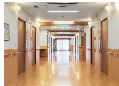
幅広くゆったりとした廊下