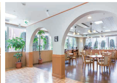
音楽や読書など、思い思いにお過ごしいただけるカフェ