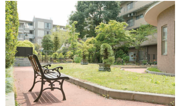
豊かな緑に満たされた庭