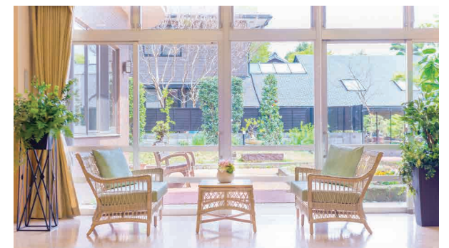
大きな窓で開放感あふれる休憩スペース