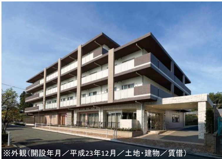
※外観(開設年月/平成23年12月/土地・建物/賃借)