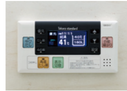
浴室給湯リモコン