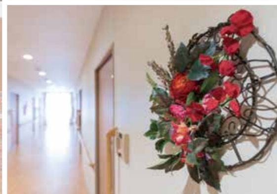
平成28年4月撮影／建物・賃借

神社やお寺も多い、穏やかな住環境。 明るさと開放感に包まれた、心地よい暮らしへ。