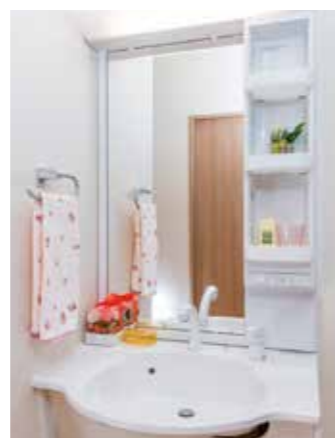
清潔感のある洗面化粧台を各居室に設置