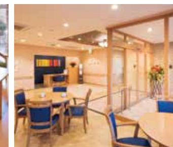
エントランスロビー（カフェ併設）