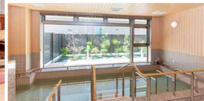
坪庭を眺めながら温泉気分に入れる大浴場

昨日より今日、今日より明日と、笑顔の数がひとつでも増えていくように。 お一人おひとりにとって本当にうれしい介護をカタチにまいります。