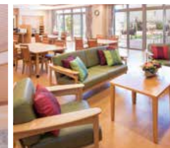
ダイニング内の団楽スペース