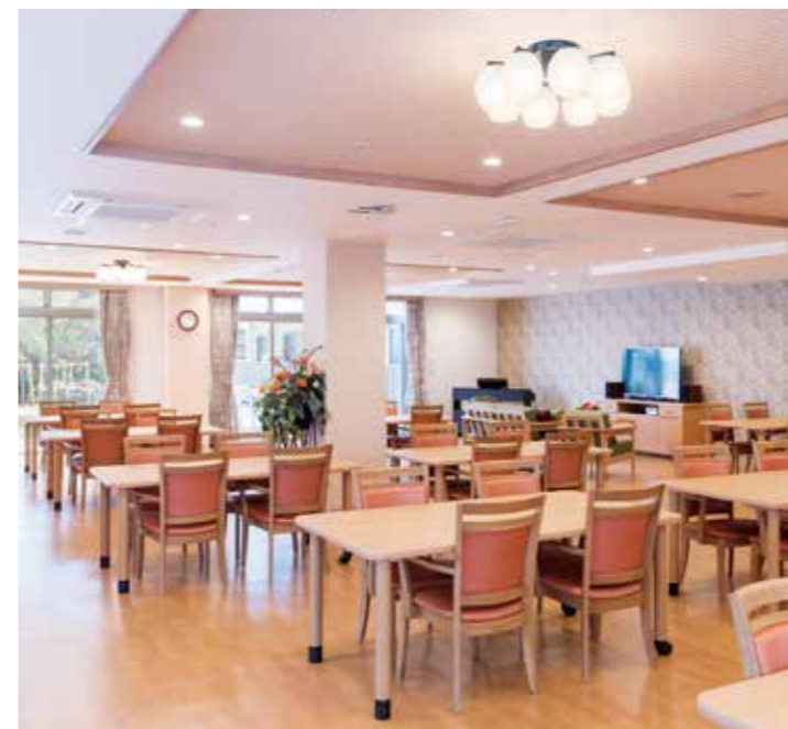
南向きの大きな窓から陽光が差し込む、明るさいっぱいダイニング

ゆとりと癒しに満ちた共用空間・設備をご用意。 広々としたリビングダイニング、憩いの場となる中庭では春に桜も楽しめます。