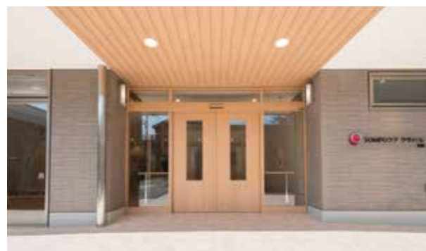
ここに住まう方々やご家族を優雅に出迎えるエントランス

神社やお寺も多い、穏やかな住環境。 明るさと開放感に包まれた、心地よい暮らしへ。