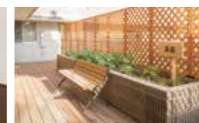
花や野菜を育てる農園

四季を彩る、ゆたかな武蔵野の緑をそばに。 心地よくくつろぎの日々を、ここ東所沢で。