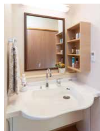
清潔感のある洗面化粧台を各居室に設置