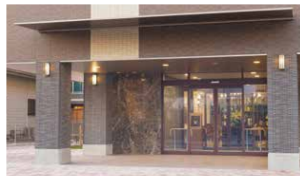
ここに住まう方々やご家族を優雅に出迎えるエントランス ※建物写真は平成25年10月撮影/建物:賃借

四季を彩る、ゆたかな武蔵野の緑をそばに。 心地よくくつろぎの日々を、ここ東所沢で。