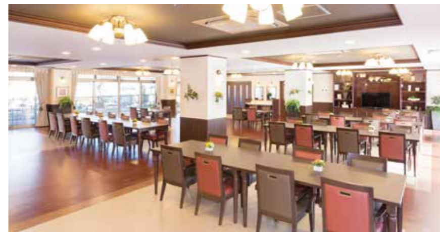
大きな窓から陽光が差し込む明るいダイニングなど、ご入居者さまに心地よく過ごしいただける共用スペース

ゆったりとしたダイニング(食堂)や思い思いに過ごせるカフェなど、日常的にゆとりと癒しを実感できる共用空間・設備をご用意しています。