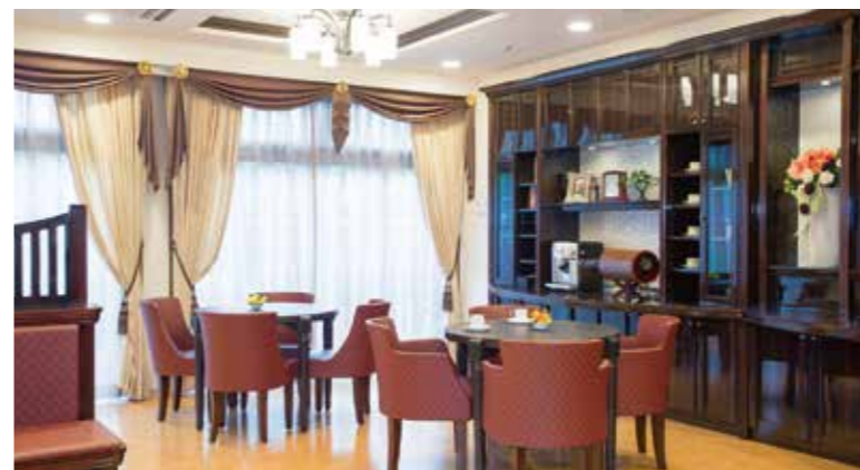
落ち着いたカフェをはじめご入居者さまに心地よくお過ごしいただける共用スペース

ゆったりとしたダイニング(食堂)や思い思いに過ごせるカフェなど、日常的にゆとりと癒しを実感できる共用空間・設備をご用意しています。