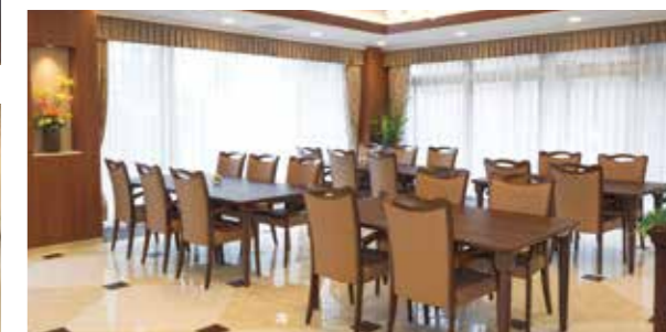
大きな窓に面し明るさいっぱいのダイニング

首都圏からのアクセスが良好なホーム。 自然の豊かさも感じられる、充実の日々をお愉しみください。