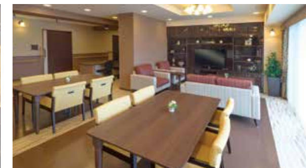
ご入居者さまの憩いの場となるラウンジ