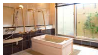
ゆったりとした気分で入れるヒノキ風呂