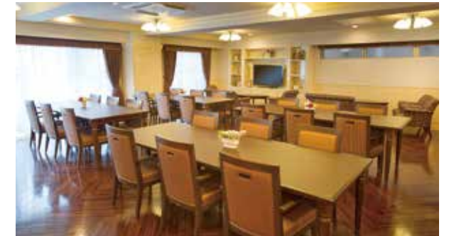
大きな窓に面し明るさいっぱいのダイニング