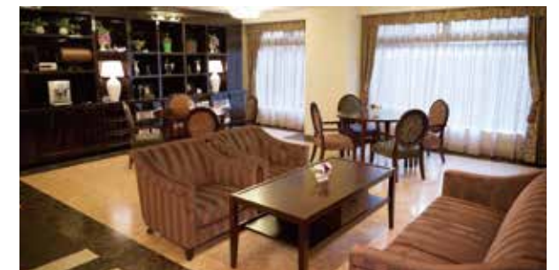
思い思いに過ごしていただけるカフェ

駅の近さに加え、バスのアクセスも抜群のホーム。 豊かな自然が広がるこの街で、「快適」な暮らしがはじまります。