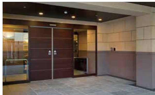
ここに住まう方々やご家族を優雅に出迎えるエントランス ※建物写真は平成24年4月撮影／建物：賃借

駅の近さに加え、バスのアクセスも抜群のホーム。 豊かな自然が広がるこの街で、「快適」な暮らしがはじまります。