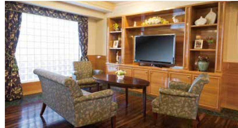
落ち着いたラウンジをはじめご入居者さまに心地よく過ごしていただける共用スペース