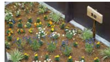
季節ごとの花や収穫が楽しめる農園