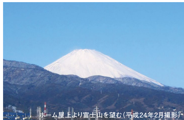
ホーム屋上より富士山を望む（平成24年2月撮影）

「海」と「山」に囲まれた景勝地、鴨宮。 自然あふれるこの地で、心地よい暮らしが始まります。