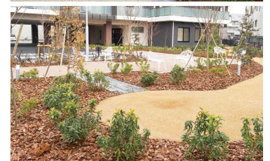
会話やティータイム、読書などを楽しめる開放感いっぱいのテラス