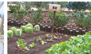
花や野菜を育てる農園

「海」と「山」に囲まれた景勝地、鴨宮。 自然あふれるこの地で、心地よい暮らしが始まります。