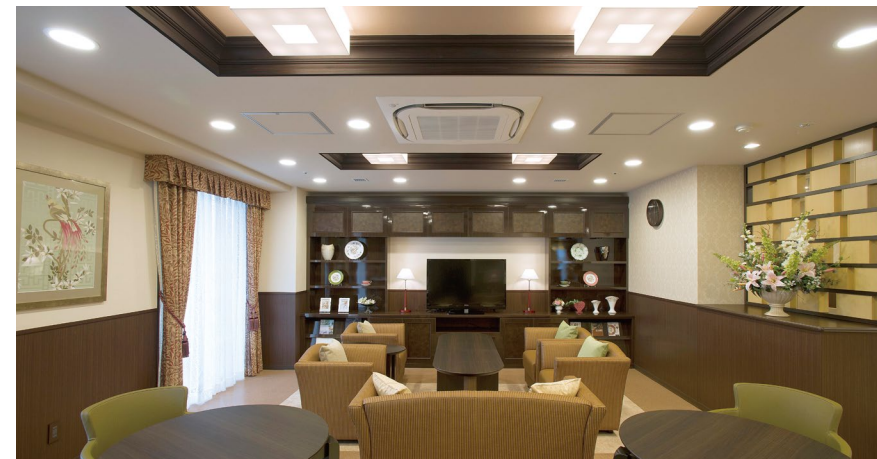
開放的なラウンジをはじめご入居者さまに心地よく過ごしいただける共用スペース

窓の大きな明るいダイニング（食堂）や思い思いに過ごせるカフェなど、日常的にゆとりと癒しを実感できる共用空間・設備をご用意しています。