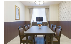
ご家族さまとの面会にもご利用いただける相談室