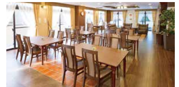
大きな窓から陽光が差し込む明るさいっぱいのダイニング（食堂）

昨日より今日、今日より明日と、笑顔の数がひとつでも増えていくように。 お一人おひとりにとって本当にうれしい介護をカタチにしていまいます。