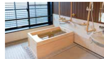
ゆったりとした気分に入れるヒノキ風呂