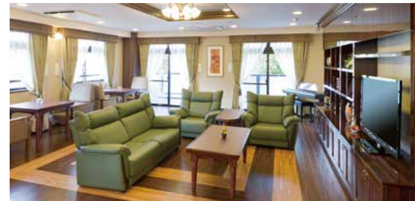
開放的なラウンジをはじめご入居者さまに心地よくお過ごしいただける共用スペース

窓の大きなダイニング（食堂）や各階に設けたラウンジをはじめ、 日常的にゆとりと癒しを実感できる共用空間・設備をご用意しています。