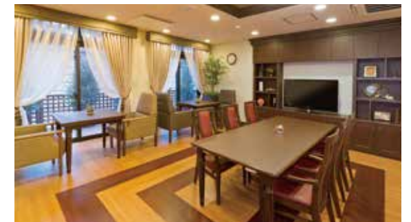
思い思いにお過ごしいただけるラウンジ