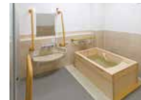
ゆったりとした気分で入れるヒノキ風呂