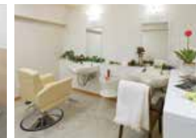
いつまでも美しくいていただくための 理美容室