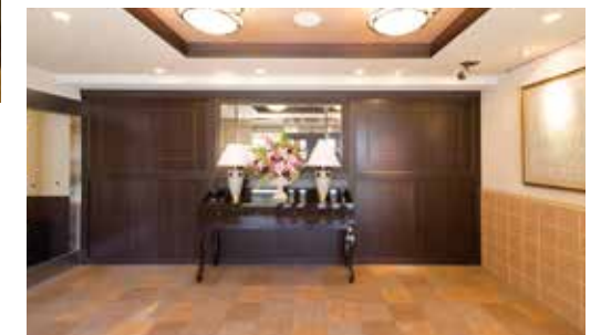
優雅で落ち着いた雰囲気のエントランスホール

昨日より今日、今日より明日と、笑顔の数がひとつでも増えていくように。 お一人おひとりにとって本当にうれしい介護をカタチにしていまいます。