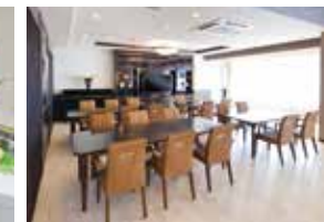
大きな窓に面し 明るさいっぱいのダイニング(食堂)