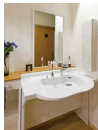
清潔感のある洗面化粧台を各室に設置