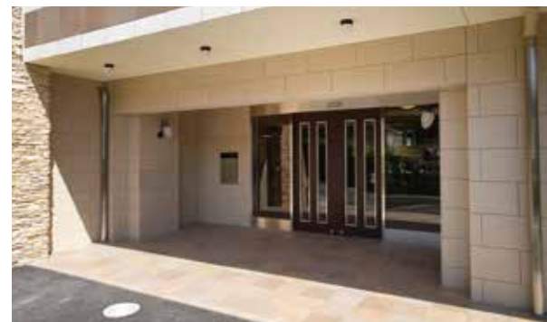
ここに住まう方々やご家族を優雅に出迎えるエントランス ※建物写真は平成23年4月撮影／建物：賃借

三浦半島随一の桜の名所衣笠山公園に抱かれた、 自然の潤いと開放感あふれる高台の暮らしをお愉しみください。