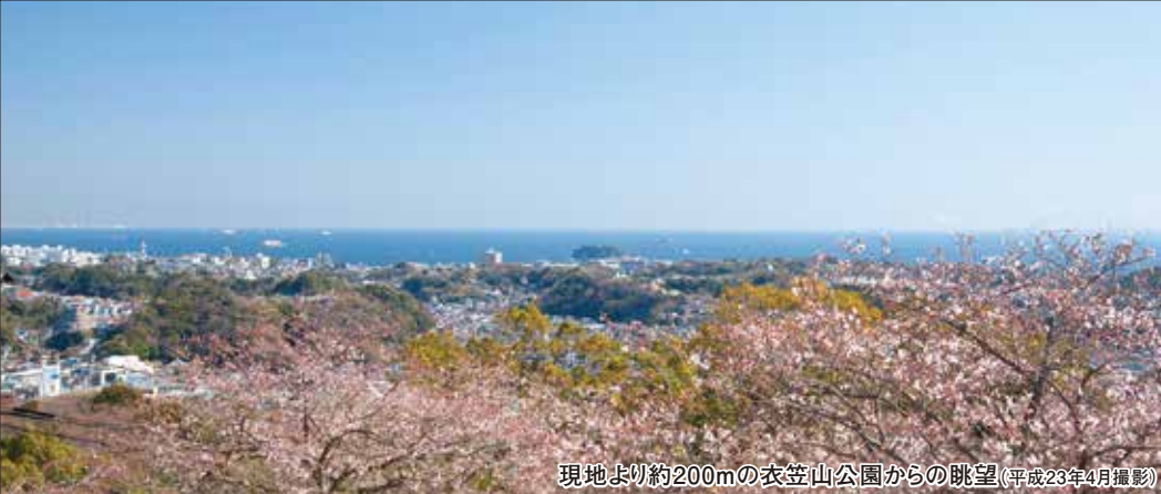
現地より約200mの衣笠山公園からの眺望(平成23年4月撮影)