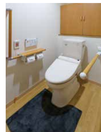
車椅子でも使いやすいトイレ