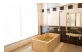
ゆったりとした気分に入れるヒノキ風呂