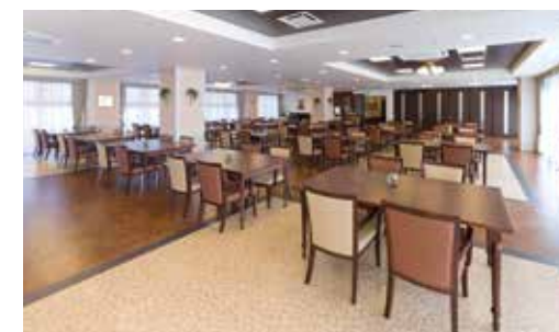
大きな窓に面し明るさいっぱいのダイニング(食堂)