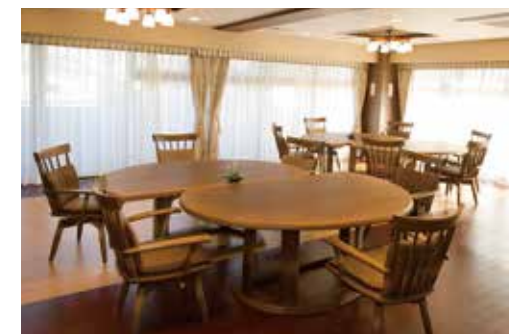
ご入居者さまの憩いの場となるラウンジ