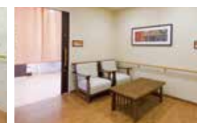
お風呂上がりにくつろげる湯上がりコーナー

豊かな緑に恵まれた武蔵野。 この地に相応しい開放感溢れる邸宅で、のびやかな毎日を愉しむ。