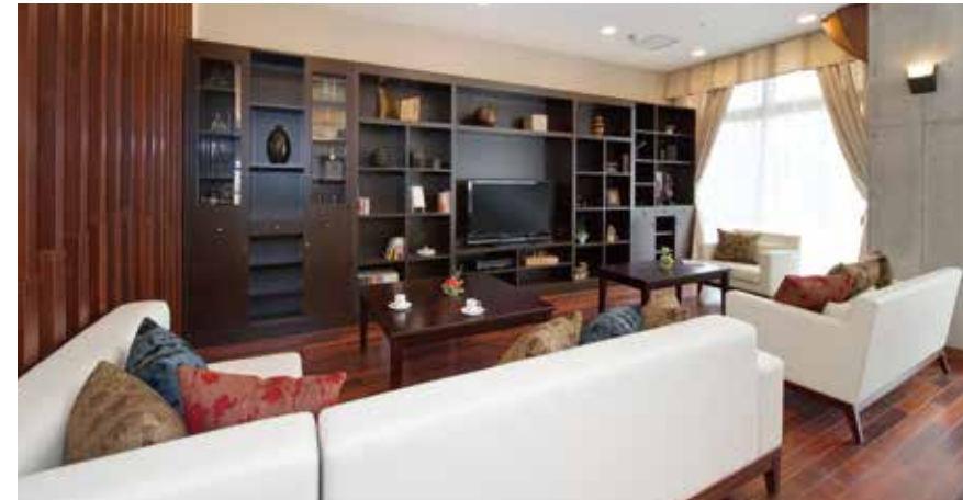
落ち着いたラウンジをはじめご入居者さまに心地よく過ごしていただける共用スペース

庭に面したダイニング(食堂)や居室階に2つずつ確保したラウンジをはじめ、日常的にゆとりと癒しを実感できる共用スペース・設備をご用意しています。