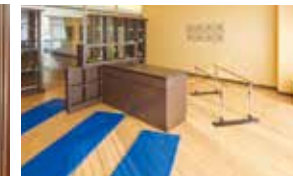
機能訓練や生活リハビリもしっかりサポート

昨日より今日、今日より明日と、笑顔の数がひとつでも増えていくように。 お一人おひとりにとって本当にうれしい介護をカタチにしていまいます。