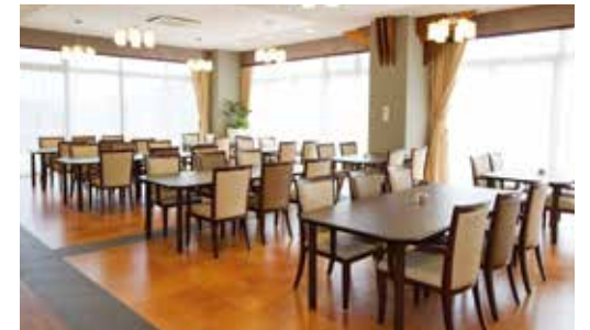
二面採光で明るく美しい眺望も楽しめるダイニング(食堂)