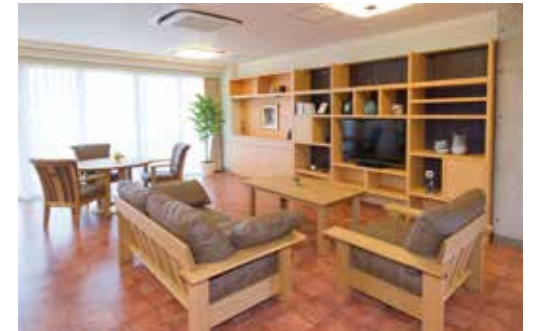
思い思いにお過ごしいただけるラウンジ