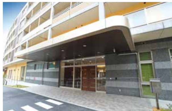
ここに住まう方々やご家族を優雅に出迎えるエントランス ※建物写真は平成22年3月撮影 / 建物: 賃借

たっぷりの陽光が降り注ぎ、豊かな眺望が広がる高台。 ゆとりと安らぎを大切にしたりゾートホテルのようなホームです。