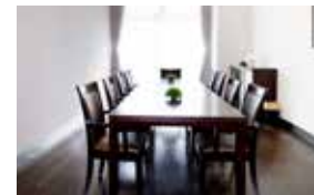
落ち着いた雰囲気相談室