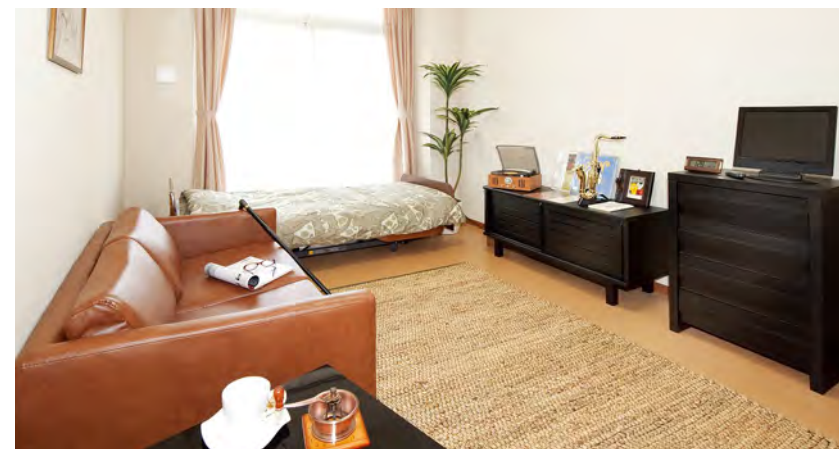
居室(モデルルーム)

お気に入りの家具を持ち込んでいただき、ご自分らしいインテリアで楽しんでいただける居室。 安心して過ごしいただけるよう、緊急コールを各室、トイレに設置し、車椅子の利用にも配慮しています。