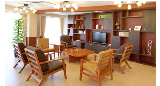
2Fリビングダイニング