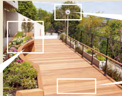
車いすの方でも無理なく手入れができる花壇 高台なので景色も堪能できます