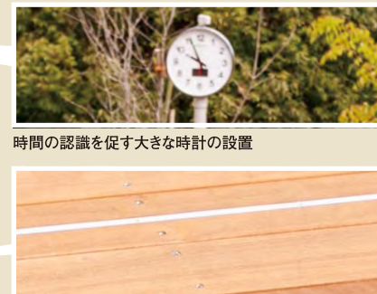
5mごとに白線を引いた、 歩行訓練に活用できる機能的な床面