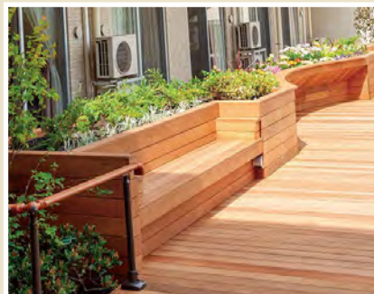
高齢の方でも座りやすい設計のベンチ

認知症の方や身体に障がいがある方も 誰もが過ごしやすい優しいデザインの中庭です。 ご入居者さまが気持ちよく日光を浴び、植物や景色を眺めながら適度に身体を動かすことができ、 花壇づくりも楽しめる仕掛けを施しています。